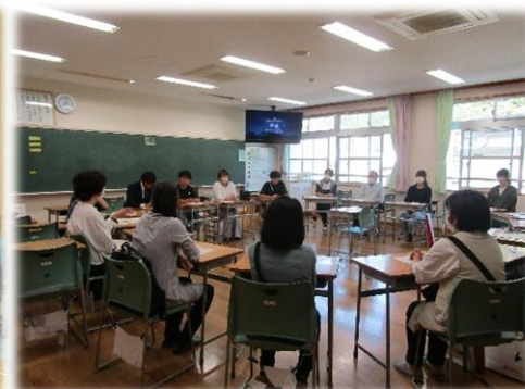
授業参観、トライやる・ウィーク説明会、学級懇談会の様子