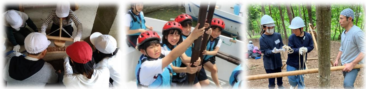
なかなか煙が出ない（火おこし） これから出港します！（カッター） このロープどうするの？（隠れ家）

5年生は、5日間辛抱すべきところは辛抱し、積極的に活動にも参加して、全員で最終日を迎えることができました。自然学校の体験で、一人ひとりが将来の自立に向けて大きな力を手に入れることができたと思います。早速学校や家庭で、この経験を活かして行ってほしいと思います。