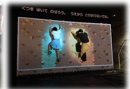
ボルダリング初挑戦 (VS パーク)