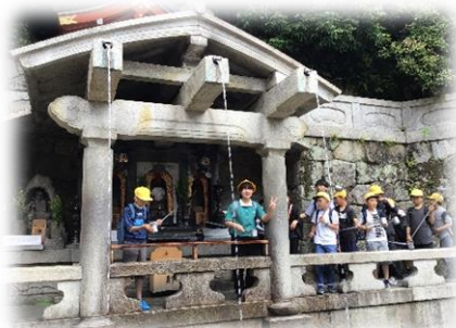
恋愛成就の滝は… (音羽の滝)

参加した6年生は全員、ルールやマナーを守り、ガイドさんの話にも耳を傾けてきちんと反応しながら、楽しむところはしっかり楽しんで、たくさんの思い出を作り、成長してくれました。