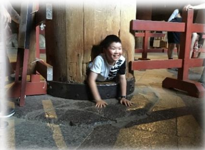
なかなか狭いぞ (東大寺)