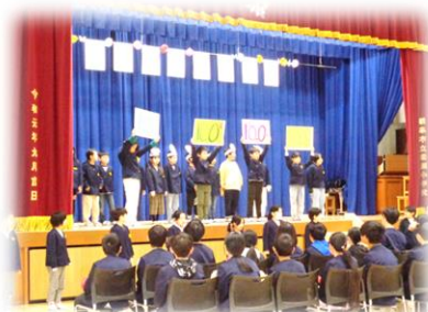
3年生：6年生との思い出