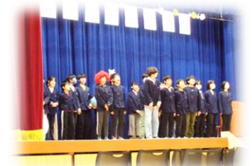
6年生：6年間の思い出