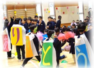
1年生：ありがとうレジャー

嬉しいこと、悲しいこと、いろいろあるけれど、学校にすればきっと何とかなる。友だちや先生がいる。一人じゃないよ。学校っていいね。