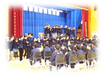
5年生：梁瀬小学校の思い出