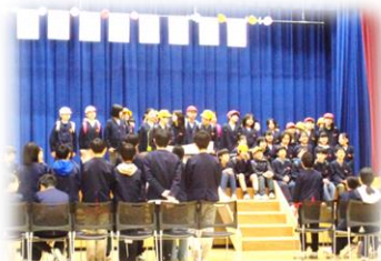
4年生：笑ってはいけない ショートコント