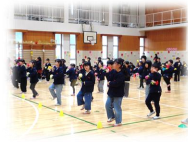
2年生：ダンス ツバメ